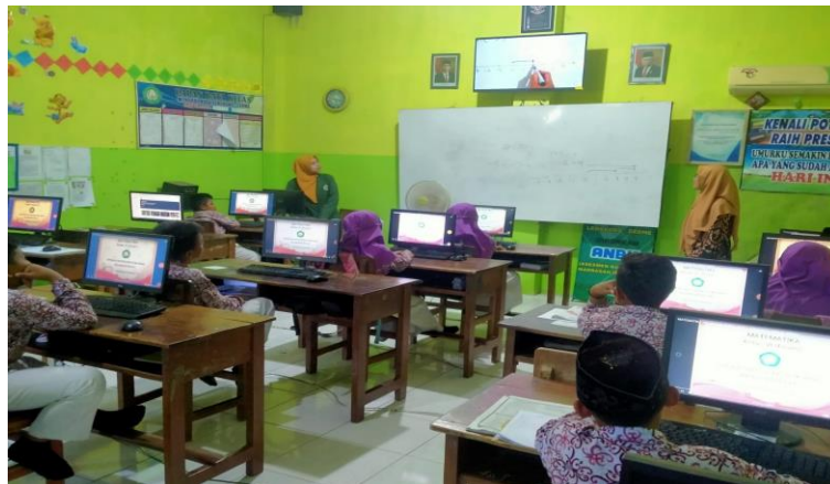
Gambar 1 Pemanfaatan Smart TV dalam Proses Pembelajaran

Sedangkan guru kelas IV (IS) dan (AH) selaku guru kelas atas, mengungkapkan bahwa proses pembelajaran berbasis digital di Madrasah Ibtidaiyah Nurul Huda Lengkong Cerme Gresik, yaitu