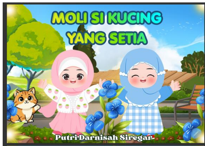
Gambar 2 Tampilan Sampul Buku

Tahap design dilakukan untuk merancang media buku cerita bergambar yang sesuai dengan kebutuhan siswa dan tujuan pembelajaran Bahasa Indonesia kelas III Madrasah Ibtidaiyah. Pada tahap ini peneliti mulai menyusun konsep media, menentukan isi cerita, memilih ilustrasi gambar, serta merancang tampilan buku agar menarik dan mudah dipahami siswa. Media buku cerita bergambar dirancang sesuai dengan karakteristik siswa kelas III Madrasah Ibtidaiyah dengan menggunakan bahasa yang sederhana, ilustrasi berwarna, serta tampilan yang menarik agar dapat meningkatkan minat baca siswa. Pada tahap ini peneliti menyusun desain sampul, isi cerita, dan tata letak gambar yang disesuaikan dengan materi membaca pemahaman.