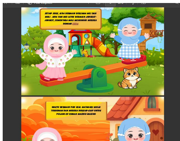
Gambar 4 Tampilan Percakapan Buku

Tahap development merupakan tahap pembuatan media buku cerita bergambar berdasarkan rancangan yang telah disusun sebelumnya. Pada tahap pengembangan, media buku cerita bergambar mulai disusun secara lengkap dengan menambahkan unsur percakapan antar tokoh agar siswa lebih tertarik membaca dan memahami isi cerita. Percakapan dibuat menggunakan bahasa sederhana sesuai dengan tingkat perkembangan siswa kelas III Madrasah Ibtidaiyah.