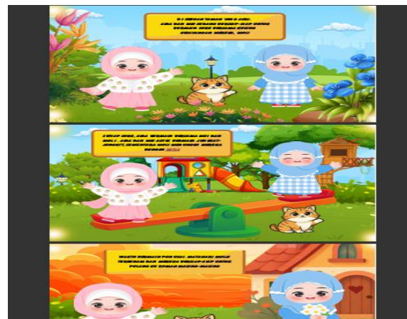
Gambar 3 Tampilan Isi Cerita

Sampul buku dirancang menggunakan kombinasi warna cerah dan ilustrasi yang menarik perhatian siswa. Pada bagian sampul terdapat judul cerita, gambar tokoh, dan identitas media pembelajaran sehingga siswa lebih tertarik untuk membaca isi buku cerita bergambar yang dikembangkan. Isi cerita dalam media disusun menggunakan kalimat sederhana yang mudah dipahami siswa sekolah dasar. Selain itu, cerita disajikan dengan ilustrasi visual untuk membantu siswa memahami alur cerita dan isi bacaan secara lebih konkret.